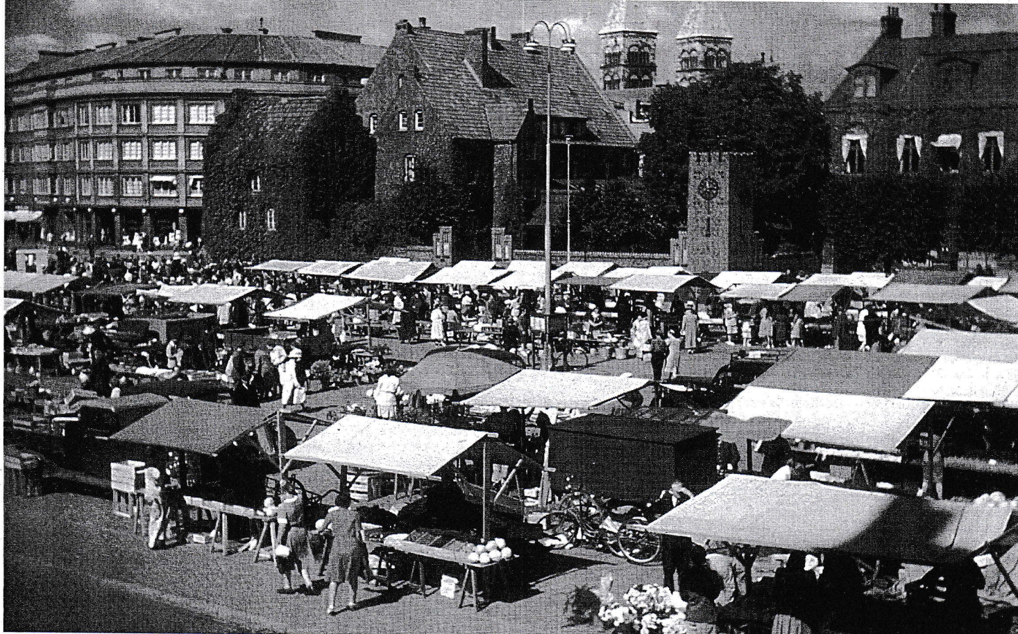
Mårtenstorget 1957. I bakgrunden syns ett klocktorn och en mur. Bakom muren låg Köttbesiktningsbyrån som kontrollerade att köttet var färskt.